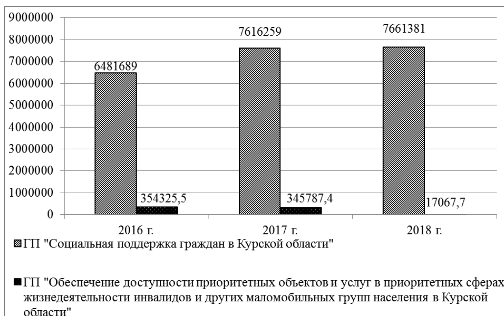
Рис. 3. Динамика расходов на финансирование государственных программ в сфере социального обеспечения в Курской области в 2016-2018 гг., в миллионах рублей

ние эффективности и качества услуг в сфере социального обслуживания населения Курской области на 2013–2018 годы» территориальные центры социального обслуживания населения Курской области в 2016 году предоставили социальные услуги более чем 94 тысячам гражданам пожилого возраста и инвалидам, что на 1,2% больше, чем в 2015 году [5].