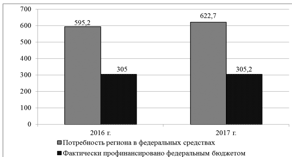
Рис. 4. Уровень финансирования переданных государственных полномочий по обеспечению инвалидов средствами реабилитации в Курской области в 2016 и 2017 гг., в миллионах рублей

В настоящее время служба функционирует на базе центров социального обслуживания в 25 районах и 4 городах Курской области;